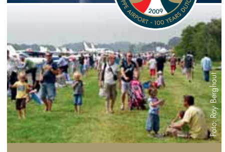
Seppe Airshow 2009

Samen met andere partijen organiseerden we de ‘Seppe Airshow 2009’, een groot succes. Met de ballonfiësta, de statische ‘100-jaar-luchtvaart’ opstelling en de air display lieten we zien hoe leuk luchtvaart kan zijn. Dit jaar herhalen we het festijn nog een keer, in samenwerking met de Technische Universiteit Delft.