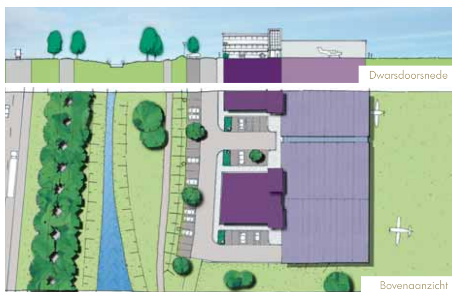
Voorbeelduitwerking Seppe Airparc

De bedoeling is dat zich op het vliegveld veel verschillende soorten bedrijven zullen vestigen. In de afgelopen periode hebben veel bedrijven zich gemeld voor een plekje op het vliegveld. Deze bedrijven hebben als overeenkomst dat ze zich allemaal op een of andere manier bezig houden met luchtvaart. We hebben nu contact met bedrijven die zich bezig houden met zakelijke vluchten met kleine toestellen, die opleidingen verzorgen of service verlenen aan vliegtuigen. Daarnaast willen we een aparte plek creëren voor de ontvangst van mensen die zakelijk vliegen vanaf Seppe Airport.